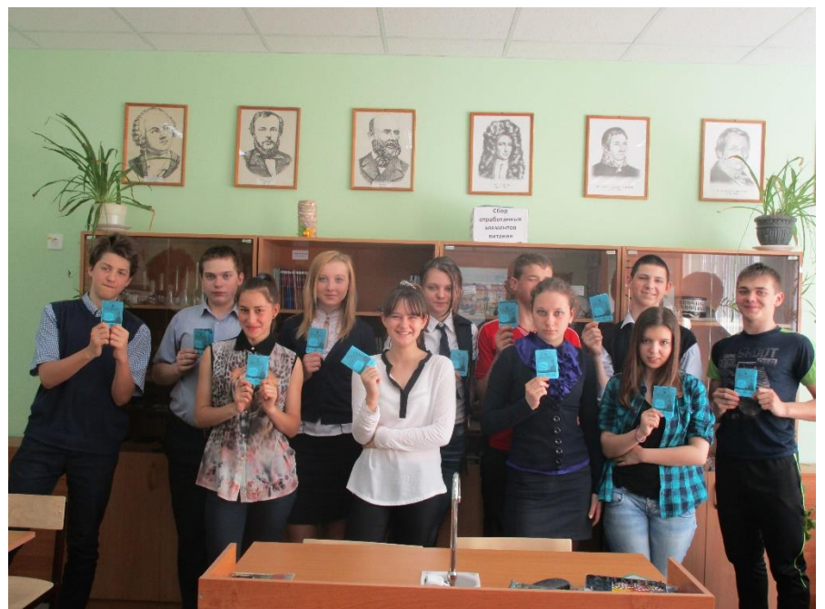
Пакетмод на память.