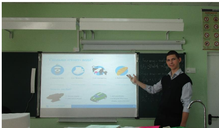
Презентация «Сохраним Капу»

Цель занятия — заложить основы ответственного отношения к водным ресурсам России и донести до школьников основные принципы сбережения воды в повседневной жизни.