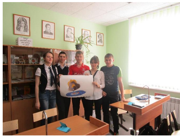
Защита творческого задания