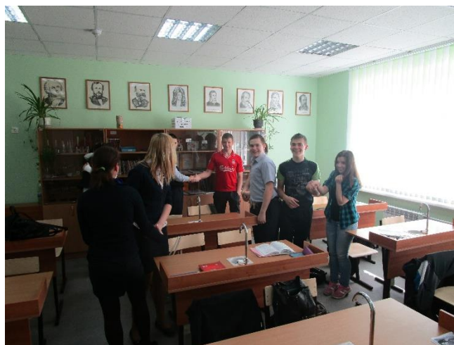
Интерактивная игра «Броуновское движение»