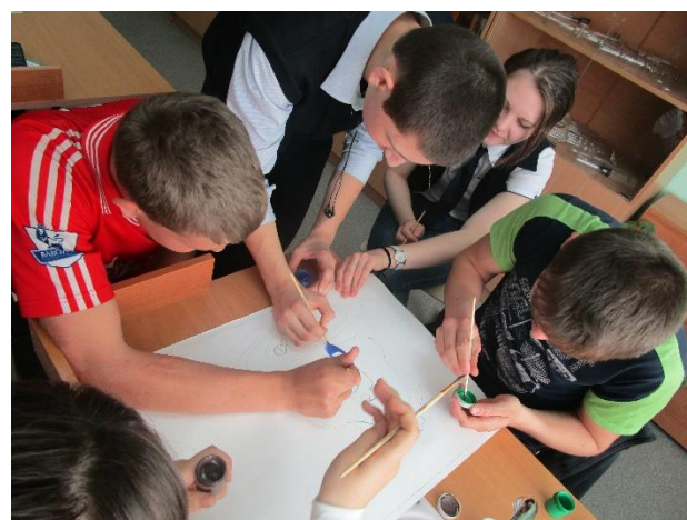
Группы выполняют творческое задание